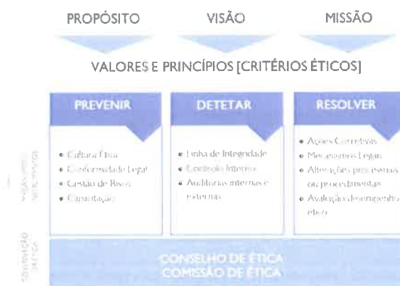
Figura 1 – Modelo de Integridade do Grupo AdP

O eixo “Resolver” integra as medidas a implementar, as metodologias de remediação para garantir a plenitude do modelo e a avaliação do desempenho ético do Grupo AdP através dos indicadores de desempenho ético.